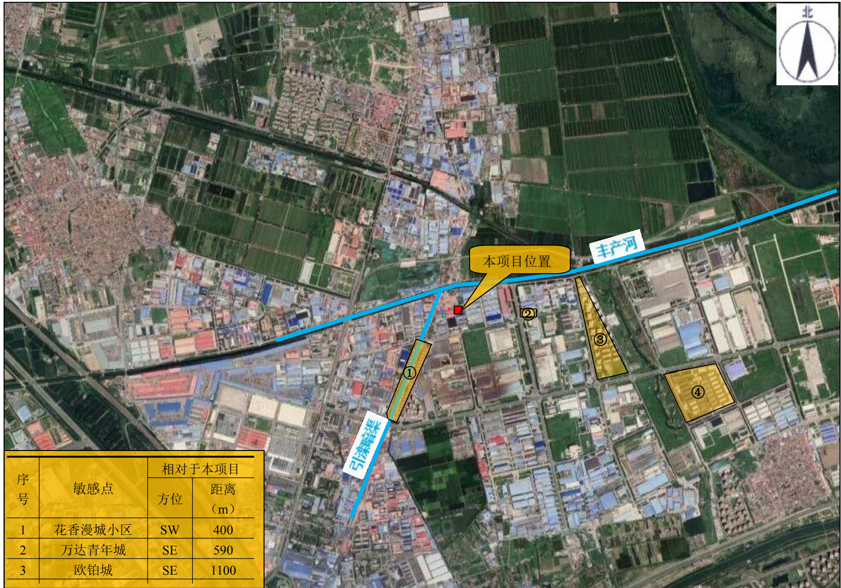
附图 2-1 项目周边关系图