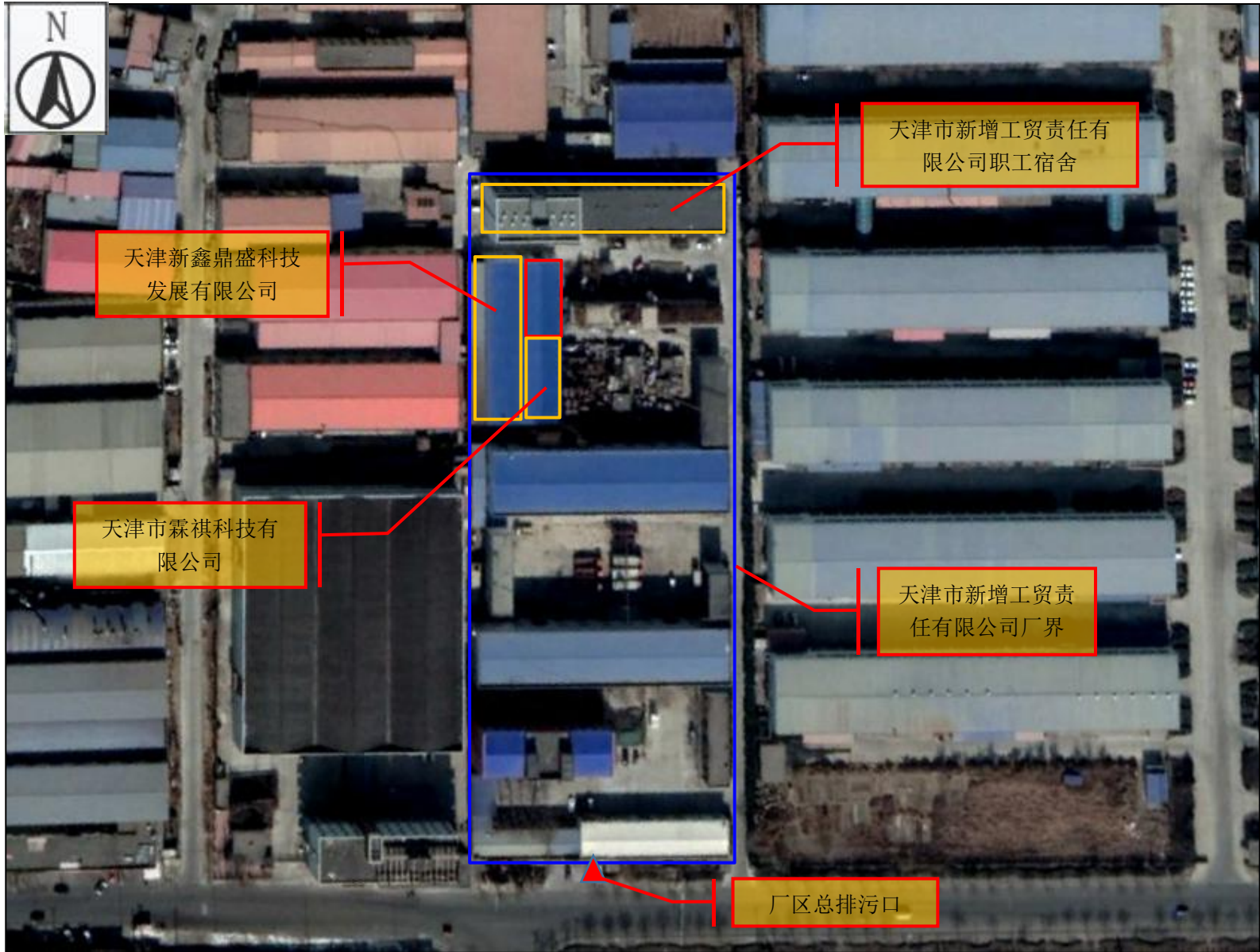
附图 2-2 项目四至关系图