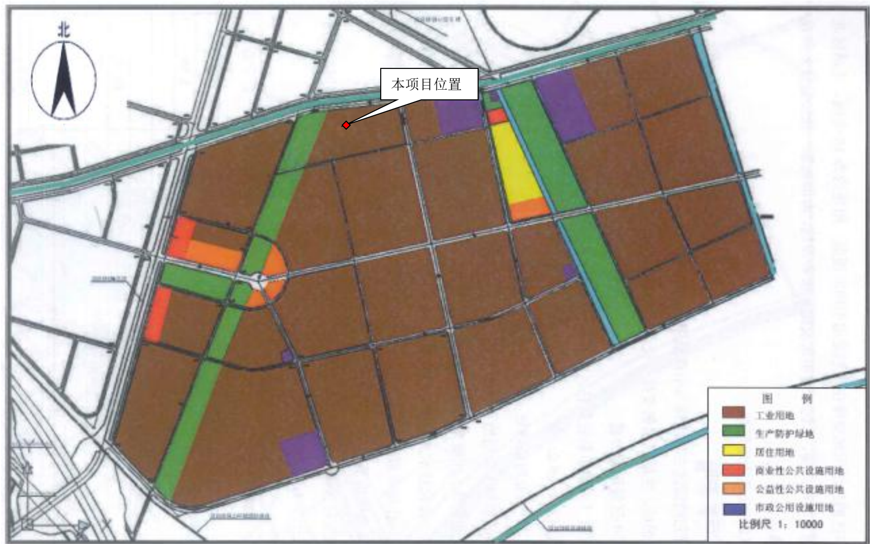
附图4 “天津市北辰科技园区环外控制性详细规划”环外发展区总体布局图